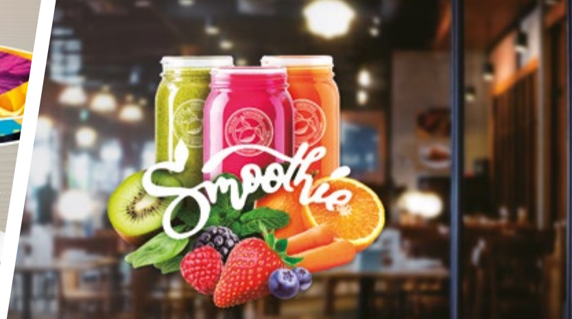
DÉCORATION DE VITRINES