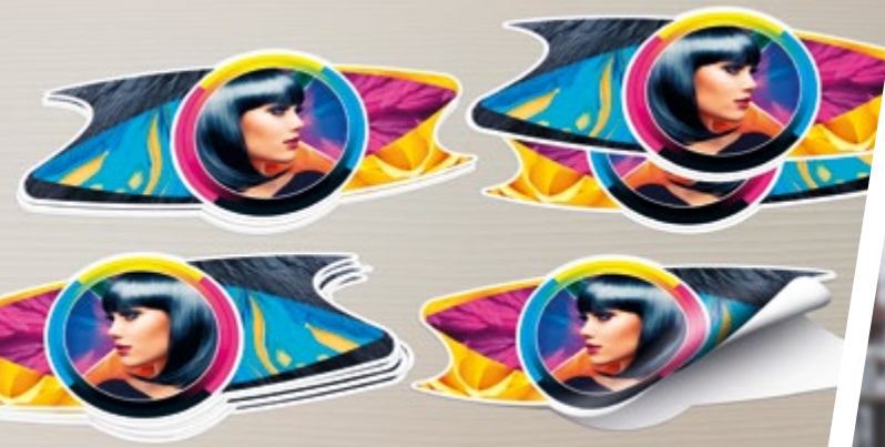
ÉTIQUETTES ET ADHÉSIFS DÉCOUPÉS