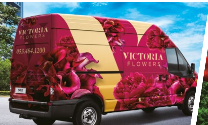
COVERING DE VÉHICULES