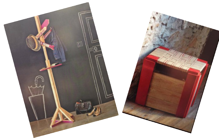
illustration page suivante